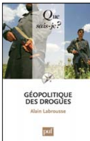
Alain Labrousse, Géopolitique des drogues, Collection « Que sais-je ? », PUF, 2011